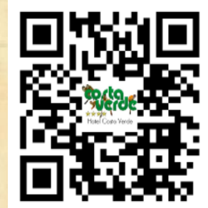
HOTEL COSTA VERDE