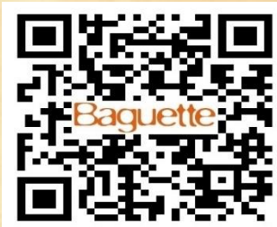
BAGUETTE BACKERY & CAFE